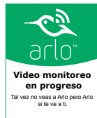
Pegatina para ventana