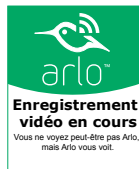
Autocollant pour fenêtre