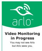
Naklejka na szybę