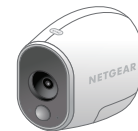
Arlo-kamera uden kabler