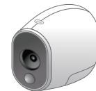
Arlo vezeték nélküli kamera