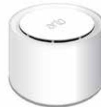
Stacja bazowa Arlo