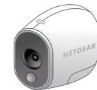
Câmara sem fios Arlo