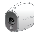
Cameră fără cablu Arlo