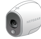
Arlo Kablosuz Kamera