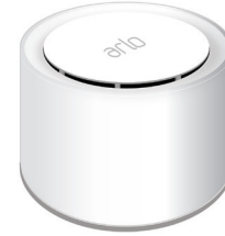
Arlo baz istasyonu