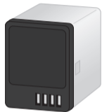
充電式バッテリー